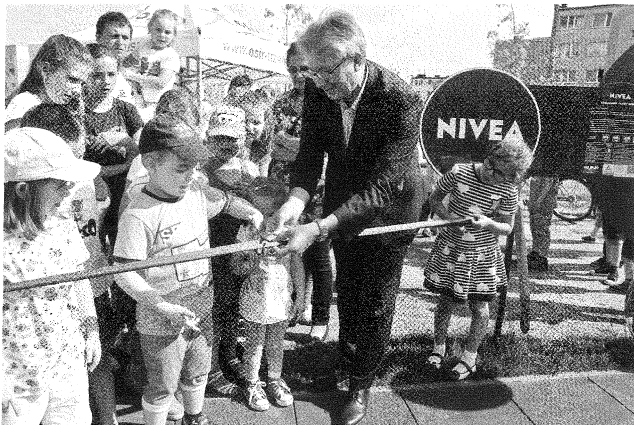
— Srem--_Zdjecia z otwarcia_NIVEA_P_2016 (8).jpg