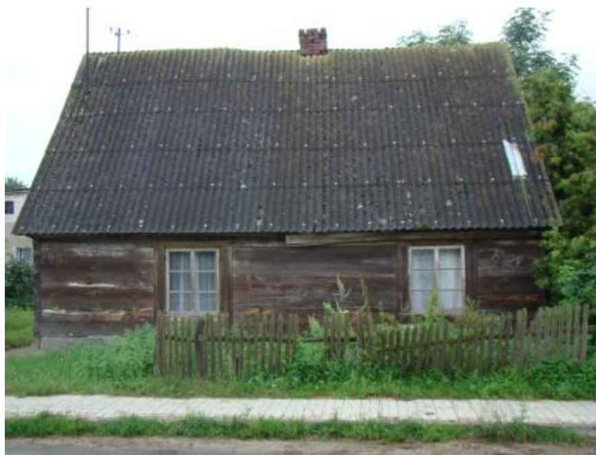
Najstarsze zabudowania w miejscowości Gnojno.