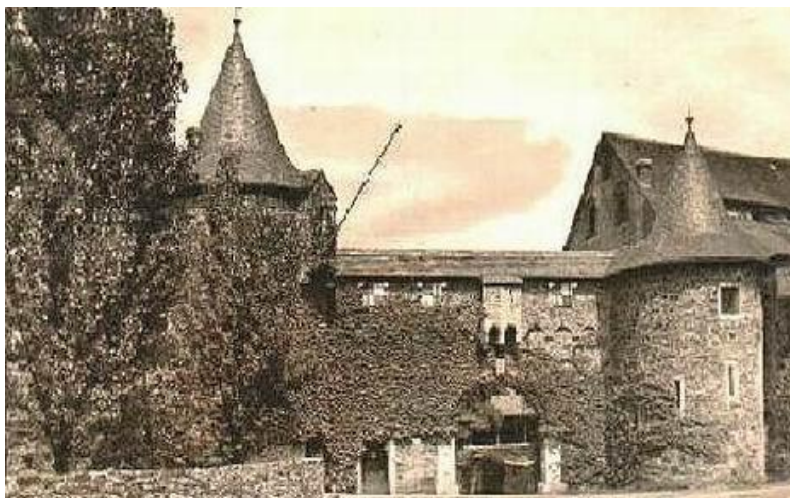
Symulacja graficzna pałacu Sznajdera

W okresie drugiej wojny światowej pałac uległ zniszczeniu wraz z otaczającymi go budynkami.