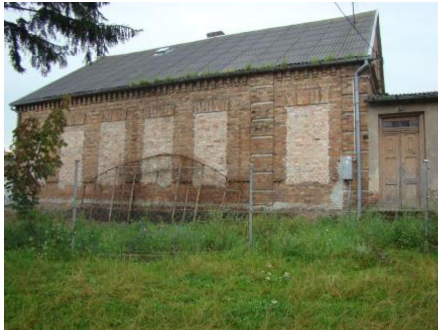
Stary budynek szkoły podstawowej.

Historyczną budowlą jest też stara, powstała na przełomie XIX i XX wieku szkoła, do której uczęszczały dwa ostatnie pokolenia mieszkańców wsi. Obecnie stanowi własność prywatną.