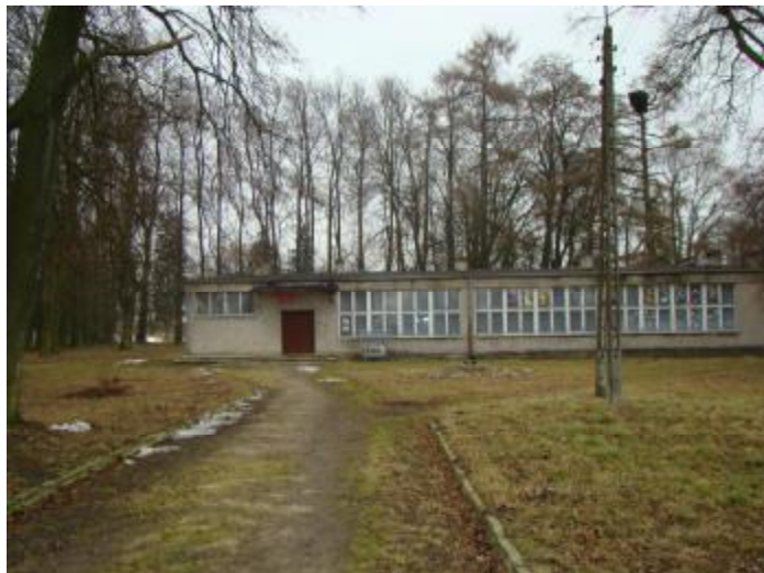
Budynek świetlicy i biblioteki.

Na podstawie zdjęć map ewidencyjnych wsi z okresu 1919 i 1929 roku należy przyjąć, że pierwotnie park stanowił sad i grunty orne, a kompozycję i obecny układ uzyskał dopiero po 1929 roku, po tym okresie powstał też obecnie istniejący drzewostan. Park został wpisany do rejestry zabytków w dniu 10 października 1981 roku pod numerem 282/81.